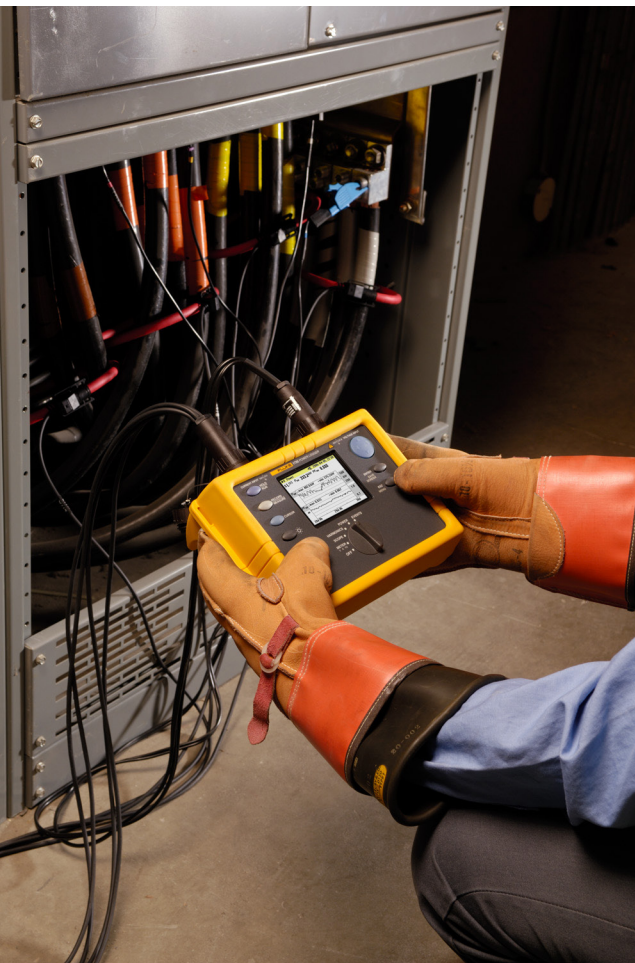
Настройка интервалов регистрации.

приборы. Наличие трех фаз затрудняет измерение мощности или энергопотребления, особенно, если вы планируете использовать меры повышения эффективности, чтобы снизить расход энергии.