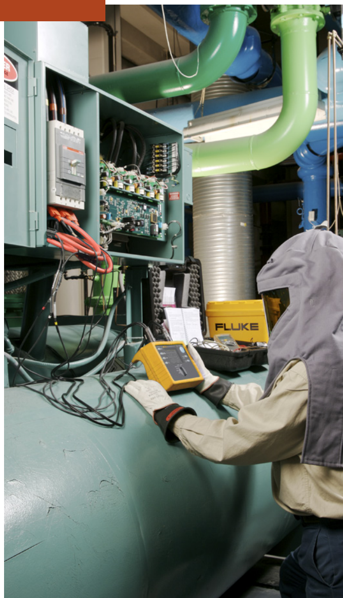
Использование регистратора электроэнергии Fluke 1735 для регистрации энергопотребления охладителя и определения эффективности оборудования.

Обычно в промышленном или коммерческом предприятии используется трехфазная система распределения электроэнергии, а затем эта энергия используется различными способами: для отопления, управления трехфазными электродвигателями и электроприводами или для питания однофазных потребителей, таких как компьютеры и осветительные