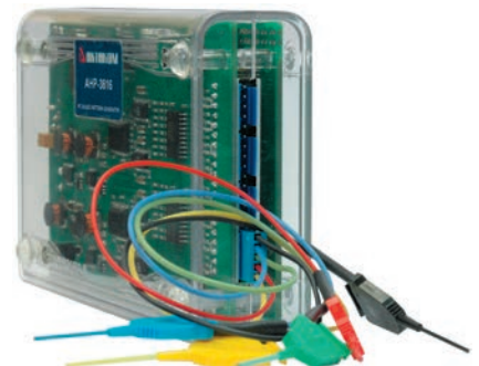
Рис. 2. Генератор цифровых последовательностей АКТАКОМ АНР-3616

В общем случае последовательность действий при работе с цифrogramмами выглядит следующим образом.