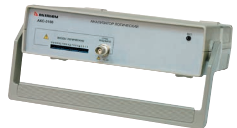
Рис. 1. Логический анализатор АКТАКОМ АКС-3166